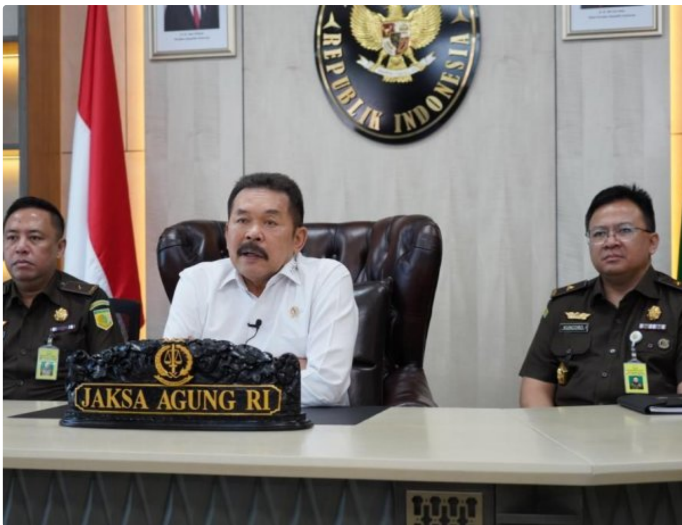
Jaksa Agung, Burhanuddin